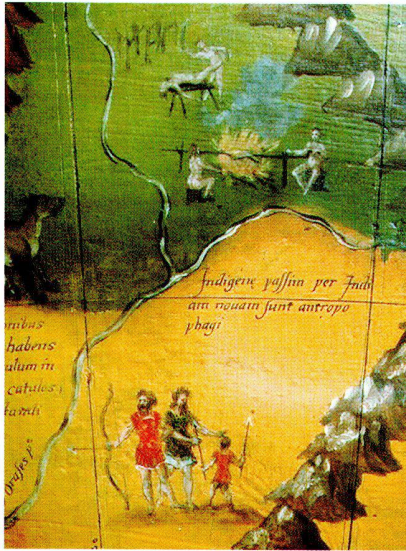
Bildausschnitt aus dem Erd- und Himmelsglobus von St. Gallen: «Zwei Bewohner der Neuen Welt braten Menscheiteile über offenem Feuer».