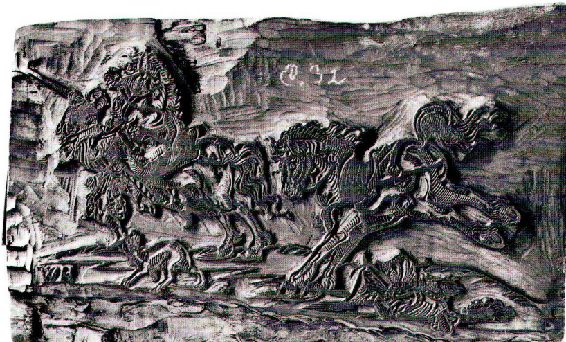
Abb. 4: Hans Weigel d.Ä.: Zwei durchgehende Pferde, um 1560 (?), Holzschnitt, 20x11,5 cm.