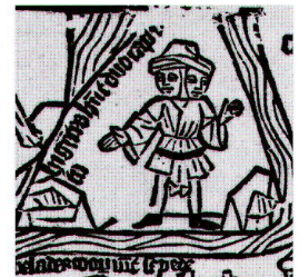
Abb. 1: Zweiköpfiger Mann mit erklärender Beischrift hi ge[n]t[el]s h[abe]nt duo capit . Ausschnitt aus dem Fragment einer Weltkarte (vgl. Abb. 2).

Der erhaltene Stock ist in erstaunlich gutem Zustand (Abb. 3). Nur an der oberen Kante finden sich grössere Ausbrüche, die das Druckbild beeinträchtigen. Die vielen kleinen, von Rissen im Holz herrührenden Unterbrechungen der gedruckten Linien sind hingegen nicht auf mechanische Einflüsse von aussen zurückzuführen. Diese Schwundrisse rühren von der Reaktion des Holzes auf wechselnde klimatische Bedingungen her. Nimmt man nur die Qualität des erhaltenen Stocks als Massstab, so wurde die Karte nicht bis zur völligen Abnutzung der Stöcke gedruckt. Allerdings lässt sich daraus nicht einfach ein mit der Zeit erfolgtes gesunkenes Interesse an der Abbildung ableiten, da ebenso andere Stöcke der Karte in stärkere Mitleidenschaft gezogen worden sein könnten.