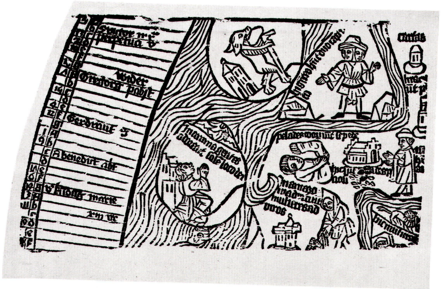
Abb.2: Unbekannt: Fragment einer Weltkarte mit Kalender, um 1480 (?), Holzschnitt, 20x11,5 cm.

Als sicher kann gelten, dass der Stock nachträglich beschnitten wurde. Sowohl rechts als auch unten sind Schriften und Figuren auf eine Art und Weise unterbrochen, die das Ansetzen eines weiteren Stocks kompliziert gestalten würden. Zudem besitzt der Stock an der oberen Kante eine Begrenzungslinie. Ein solcher in das Holz geschnittener Rahmen ist typisch für Einblattdrucke. Hier ist er mitten in der Darstellung zwar ungewöhnlich, doch darf man davon ausgehen, dass auch die beiden anderen Seiten ursprünglich eine solche Rahmenlinie besessen haben.