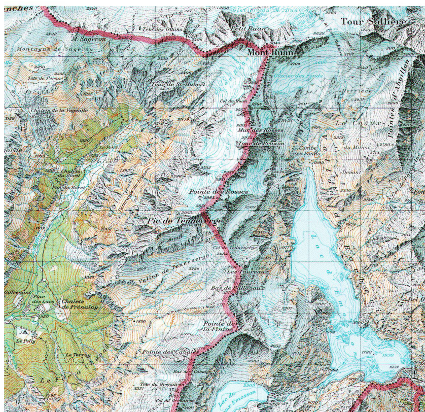
Abb. 2: Landkarte 1:50 000, Blatt 272 Martigny (Stand 2001) mit dem heutigen Grenzverlauf und dem Stausee von Emosson. Beide Kartenausschnitte auf ca. 65% verkleinert (© swisstopo BA08 1461).