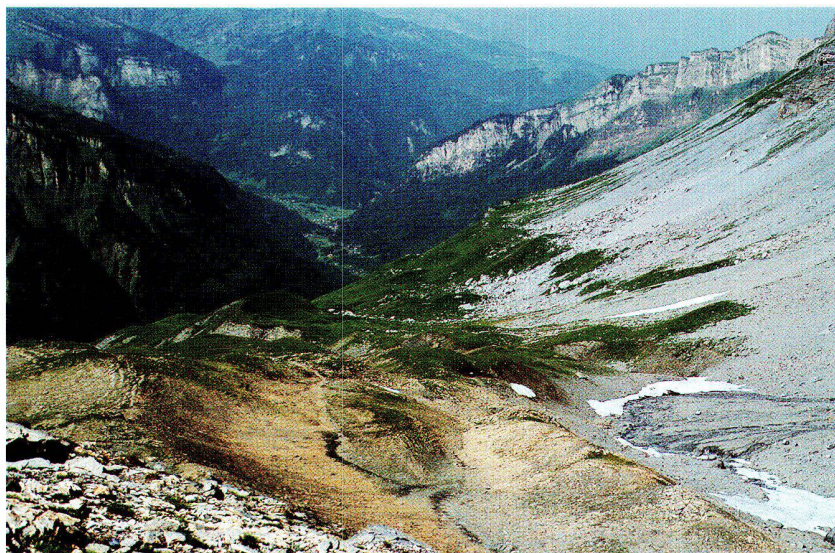
Abb. 6: Das Vallon de Tenneverge über dem Fer à Cheval.