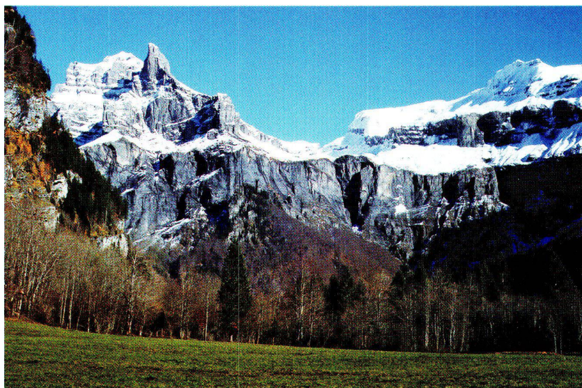
Abb. 5: Blick ins Tal von Fer à Cheval. Von links nach rechts: Pic de Tenneverge (2985 m), dessen Pass und Tal, dann die Pointe de la Finive (2838 m).

Jean Sesiano Dipl. Geologe Minéralogie, Université de Genève, 13 rue des Maraichers, CH-1205 Genève E-Mail: jean.sesiano@terre.unige.ch