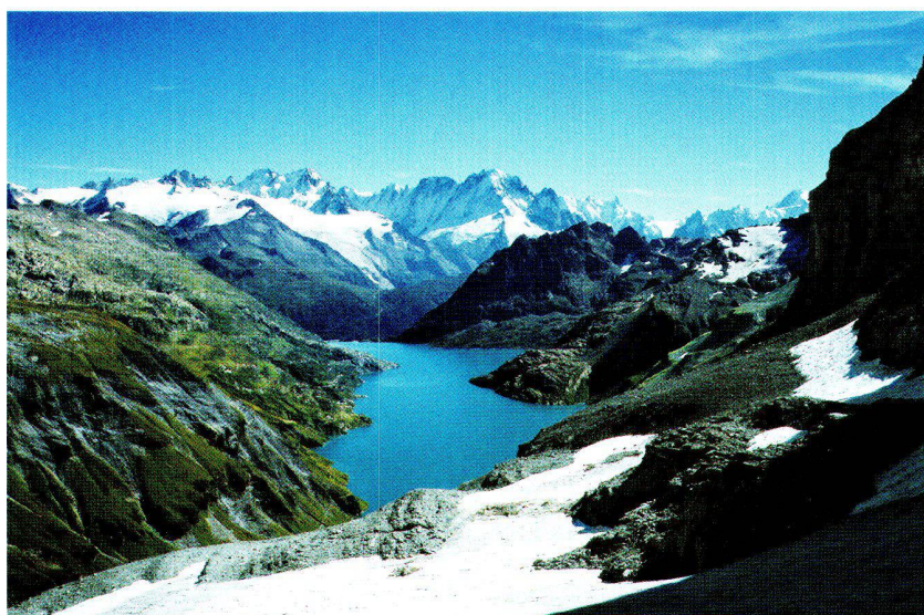
Abb. 7: Der Lac d'Emosson. Blick in südlicher Richtung mit dem Glacier du Tour und der Aiguille Verte im Hintergrund.