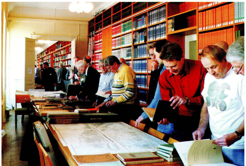
Abb. 2: Experten und Sammler hatten bei der Bücherbörse reichlich Gelegenheit zum Fachsimpeln.

möglichst viele an diesen Recherchen beteiligen. Um das zu ermöglichen, muss ein Erfassungs- und Auswertungskonzept entwickelt werden. Joachim Neumann wird Überlegungen dazu auf dem Kartographiegeschichtlichen Colloquium Anfang November in Hamburg vortragen.