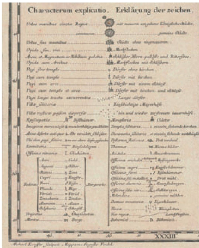
Abb. 6: Ausschnitt aus der Zeichenerklärung der Mappa Geographica Regni Bohemiae [...] von Michael Kauffer, 1722 (Brno, Moravská zemská knihovna / Sign. Moll-0090.900,AA.T.XX,40-64).