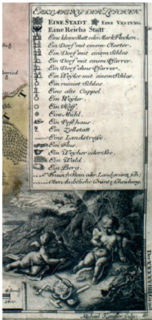
Abb.3: Zeichenerklärung der «grossen Ausgabe» der Ansbach-Karte Tabula Geographica Nova [...], gestochen von Michael Kauffer, 1719 (Staatliche Bibliothek Ansbach/XIV f 296).