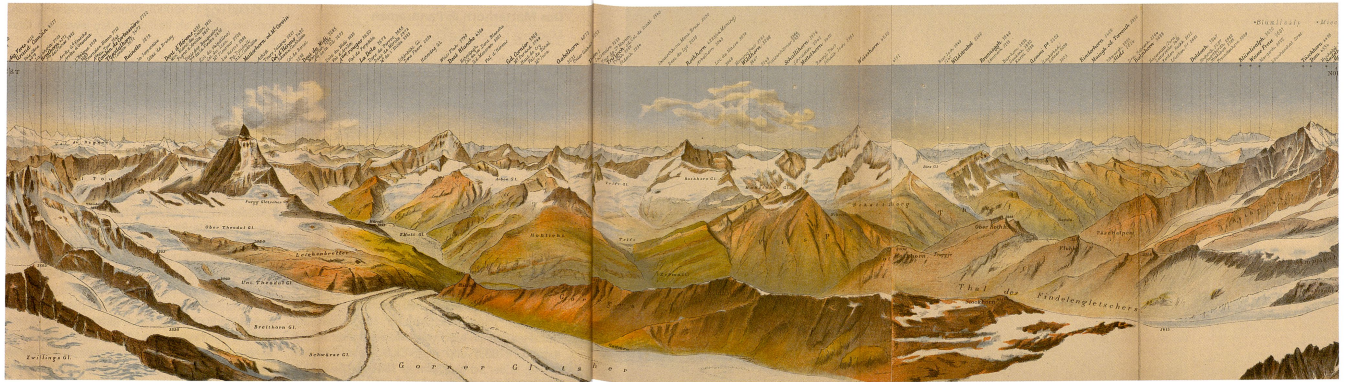
Abb. 79: Entwurf für das Panorama vom Monte Rosa (1878), Lithographie von Xaver Imfeld. Einfarbiger Druck der schwarzen Konturen mit handschriftlich eingetragenen Namen. Ausschnitt verkleinert, Gesamtformat 174 x 15 cm (ETHZ, K 803013).