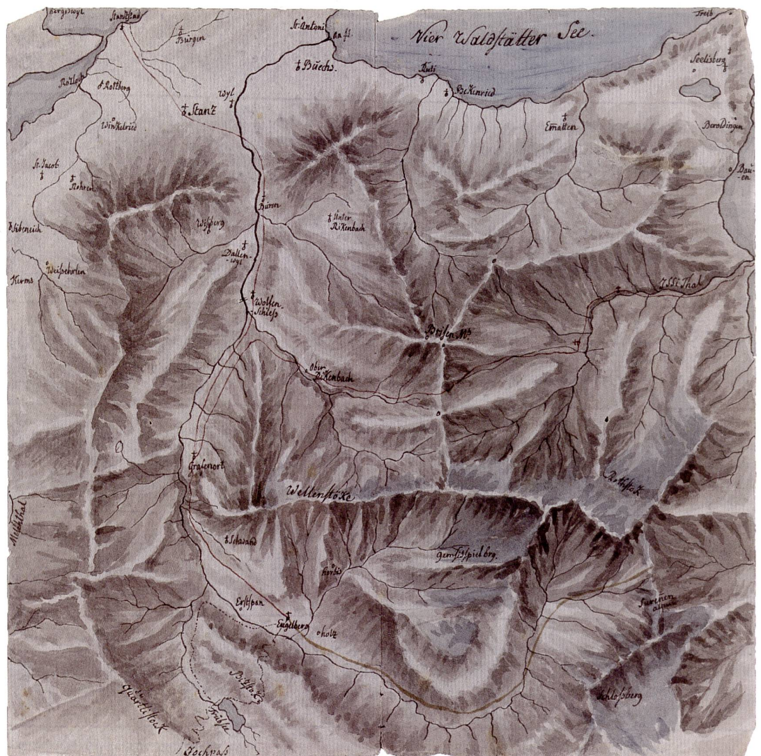
Abb. 70: Manuskriptkarte Nidwalden und Engelberg von Hans Conrad Escher, um 1800. Massstab 1:120 000, Format: 19x19 cm (ZBZ, MK HCE 26).

Den Weg nach Engelberg hätte Escher bestimmt auch ohne Karte gefunden. Wieso hat er sich trotzdem die Mühe genommen, dieses sorgfältig gezeichnete Kärtchen anzufertigen? Weshalb hat er insbesondere die Gebirgszüge so relief-scharf dargestellt? Wir wissen es nicht. Eine Vermutung geht dahin, dass er sich die Nidwaldner Gebirgslandschaft einprägen wollte, um dann mit dem fokussierenden Auge des Geologen durch das Gebiet zu wandern.