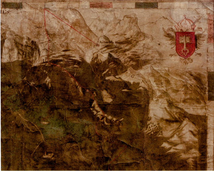
Abb.68: Karte des Klosterstaats Engelberg, um 1700 angefertigter, aquarellierter Ausschnitt aus der grossen Mappa von 1688. Format: 45x62 cm (Staatsarchiv Nidwalden, C1182/Sch.Nr. 572).

Abb.67: Mappa des Klosterstaats Engelberg 1688 von Mathias Reytz. Format: 135x117 cm, Ausschnitt Titlis auf ca. 5% verkleinert. Das südorientierte Kartengemälde zeigt den Grenzverlauf zwischen Nidwalden und dem Klosterstaat Engelberg (Nidwaldner Museum, NM 10497).