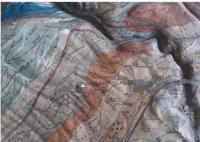
Abb. 80: Relief des Gorges de l'Arèuse 1:15 000, colorié géologiquement par Aug. Dubois, 1914. Format: ca. 66x31x6cm (SPCh).

Abb. 81: Relief des Gorges de l'Arèuse. Ausschnitt aus Abb. 80. Das Aufkleben einer gedruckten Karte auf ein dreidimensionales, stufenartiges Reliefmodell ist nur machbar, indem das Papier parzellar zerschnitten und in nassem Zustand über die Berghänge drapiert wird.