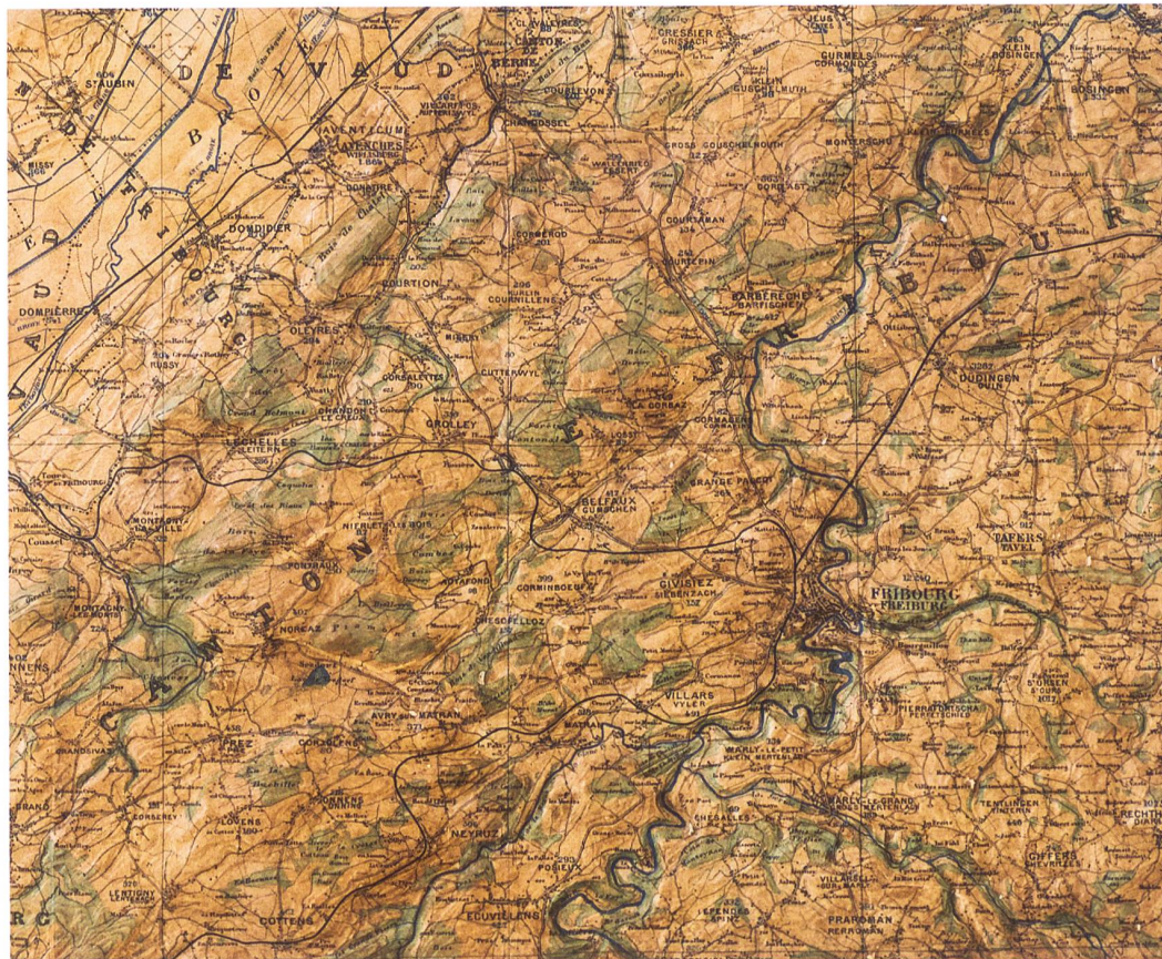
Abb. 76: Relief du Canton de Neuchâtel, Ausschnitt aus Abb. 73. Auf Blatt 4 der Basiskarte ist südlich von Murten anstelle des Stadtplans von Neuenburg die Kantonsfläche bis Freiburg ergänzt.