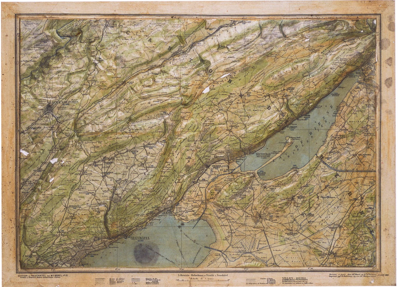
Abb. 75: Relief du Canton de Neuchâtel, Blatt 2.