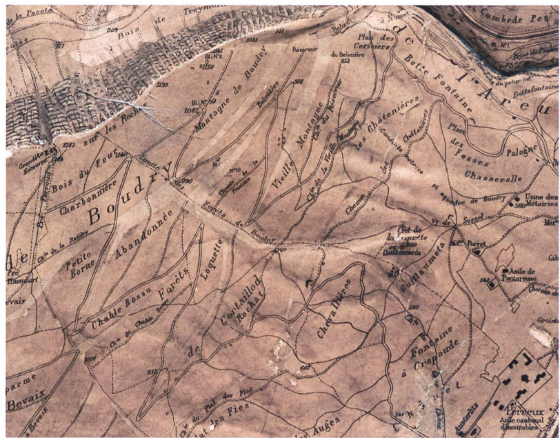
Abb. 78: Relief des Gorges de l'Areuse 1:15 000, 1914.

Beim genauen Betrachten erhält man den Eindruck, dass der Abguss des ursprünglichen Stufenreliefs – im Gegensatz zu demjenigen von Colombier (vgl. Abb. 69+70) – nachträglich ausmodelliert wurde, so dass die Flächen ausgeglichen erscheinen. Bei der darüber geklebten Karte handelt es sich um einen einfarbigen Spezialdruck der Schwarzplatte, auf der die geographischen Koordinaten und die Felszeichnung entfernt wurden. Weil Letztere für die steilen Felswände der Creux-du-Van und der Gorges de l'Areuse entlang in zweidimensionaler Darstellung zusammengestaucht wiedergegeben sind, hat Borel eine neue Felszeichnung eingefügt, die in dreidimensionaler Wiedergabe die wirkliche Erscheinungsform zeigt. Der Fluss Areuse ist von Hand in blauer Farbe eingetragen worden. Auf der aufgeklebten Karte sind links und rechts noch die Passzeichen der Schwarzplatte zu erkennen. Normalerweise werden diese nach erfolgtem Druck weggeschnitten, hier aber blieben sie wegen des grösseren Formates erhalten.