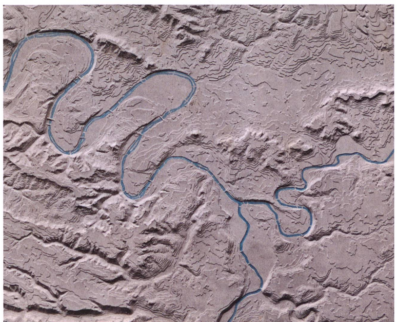
Abb. 71: Relief des Environs de Paris par Maurice Borel, 1:100 000. L'Échelle en hauteur est de 1:25 000. Changement de niveau de 5ms par gradin. 1889, Format: ca. 47x37x4 cm (BPUN).

Von diesem Reliefmodell wurden bei Delachaux & Niestlé zwei Exemplare für je 10 Franken verkauft. Alfred Borel fand diesen Preis lächerlich und fragte seinen Bruder Maurice, ob er nicht bei den Militärbehörden oder in einer lokalen Zeitung dafür Werbung machen sollte. Neuenburg wäre doch der geeignetere Ort dafür als Paris, wo so etwas keinen Wert hätte.