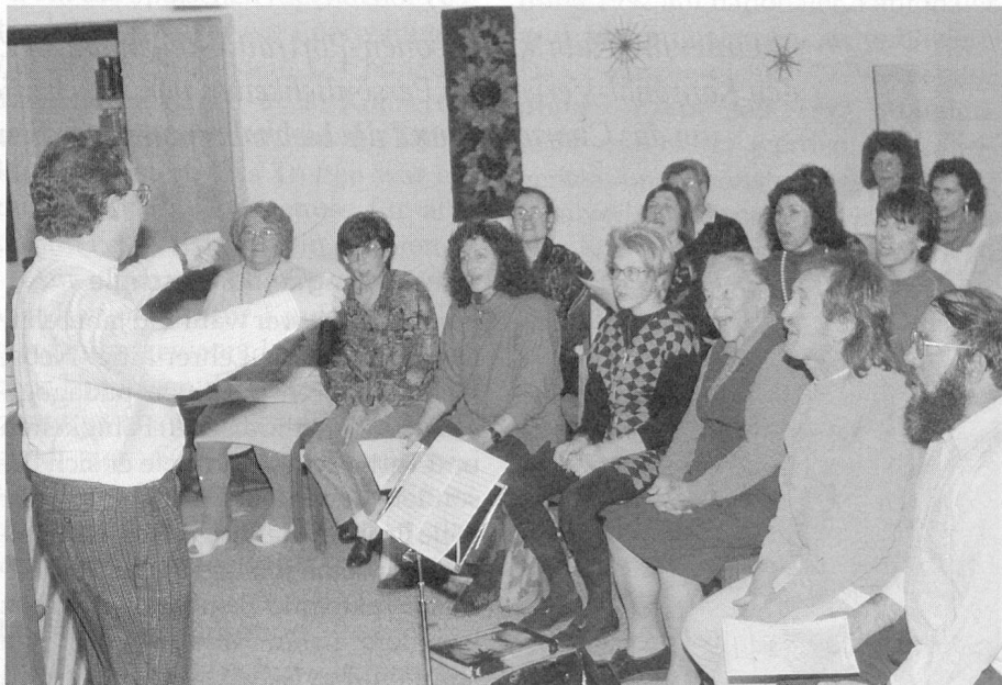
Der gemischte Chor Tuttwil, anlässlich seines Singwochenendes bei seinen Proben in gelöster Stimmung auf dem Hemberg (Toggenburg)

Wie anders war das doch am Singwochenende! Aller Alltagskram blieb zu Hause. Mitgenommen wurde neben ein paar persönlichen Effekten lediglich als wichtigstes Gepäckstück der Ordner mit den Noten.