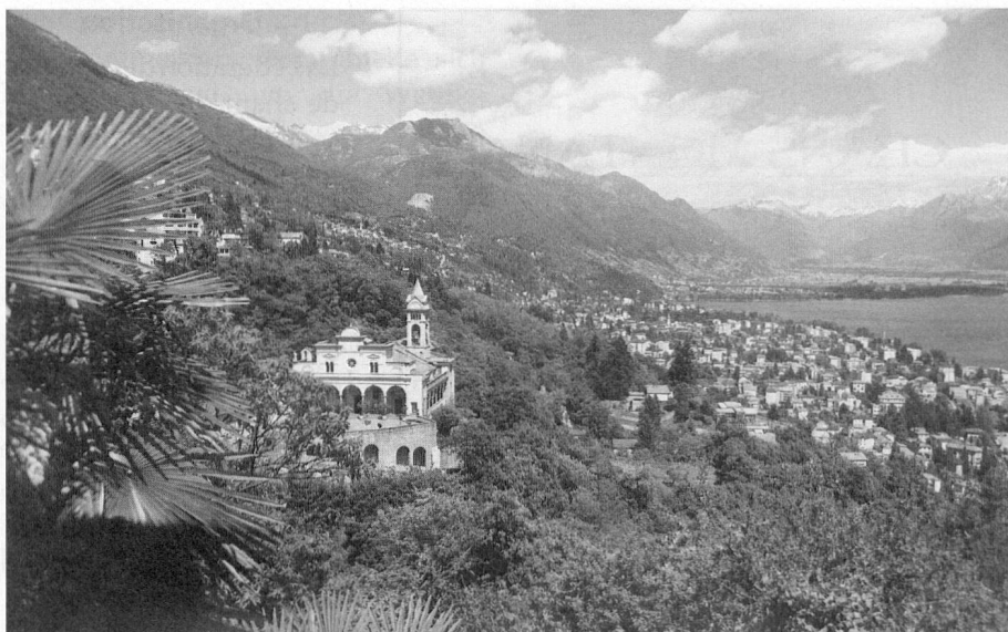
Locarno - im Sonnenland Ticino, mit Blick auf die Kirche Madonna del Sasso und den See

Der geschäftliche und gesellschaftliche Mittelpunkt der Stadt ist die Piazza Grande, wo jedes Jahr im Sommer die internationalen Filmfestspiele stattfinden und wo auch andere Veranstaltungen – vom Flohmarkt bis zum Open-air-Konzert – inszeniert werden.