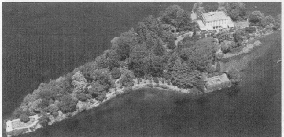
L'Île de Brissago

Ensuite, les participants auront tout le loisir de passer de bons moments ensemble et d'avoir des conversations animées.