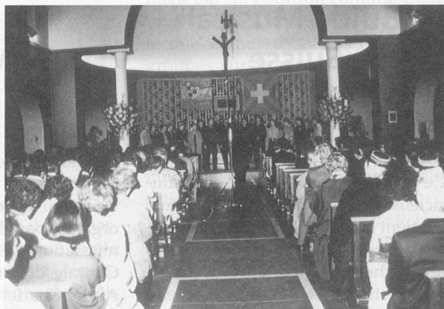
Une vue d'ensemble de la salle du concours: l'Eglise de Montana