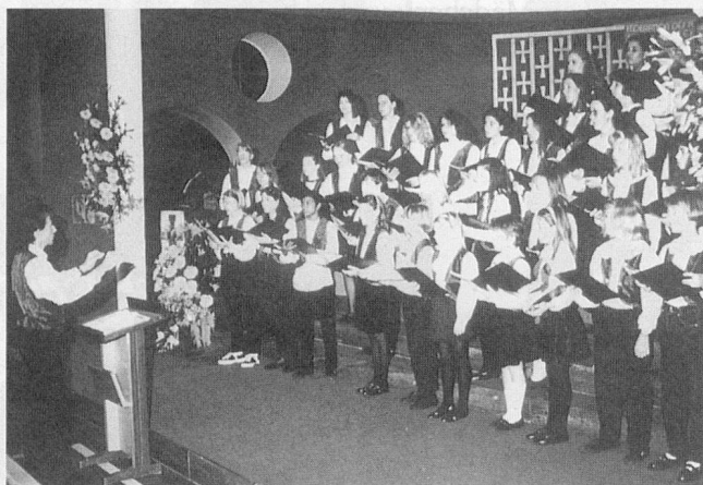
Neue Mädchenkantorei beider Basel

Die jungen Sängerinnen und Sänger genossen denn auch ganz besondere Sympathie und Anerkennung von seiten der Erwachsenenchöre.