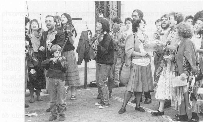
Animazione a Locarno (1991)

Interpreti e strumenti vissuti riemergono allora qua e là nel pensiero: accanto allo specialista di piva riaffiora il bambino, orgoglioso della sua polca suonata sull'organetto diatonico, accanto alla figura originale di uno dei cantori, quella timida di una danzatrice al suo primo debutto in pubblico. I Barbapedana si presentano infatti così, come un gruppo molto eterogeneo di musicisti, cantori e danzatori. Eterogeneo anche nel senso delle conoscenze acquisite perché di esso fanno parte sia conoscitori e ricercatori di musica popolare dell'arco alpino che gli allievi che ne colgono settimanalmente l'insegnamento per poi offrirne il risultato, insieme ai maestri, al pubblico. Ma l'attività della formazione non si arresta qui. Il suo intento è anche quello di animare gli spettatori che vengono coinvolti direttamente innanzitutto per la vicinanza «fisica» dei Barbapedana che, così informali come sono, scendono in genere dal palco e si mischiano fra chi li ascolta e poi perché la danza diventa un invito a tutti a partecipare. Per i più coraggiosi che si lasciano trascinare, ma anche per gli altri che osservano, il risultato è davvero divertente. C'è anche da aggiungere che molto vien lasciato all'improvvisazione: l'interazione Barbapedana-pubblico viene cioè spinta avanti secondo le reazioni dell'uno e dell'altro, con molta sensi-