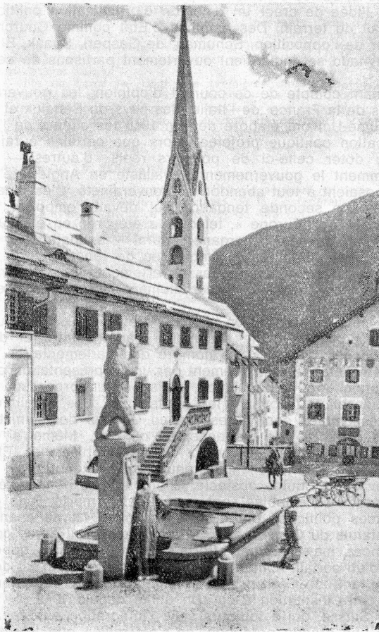
Quelque part dans les Grisons