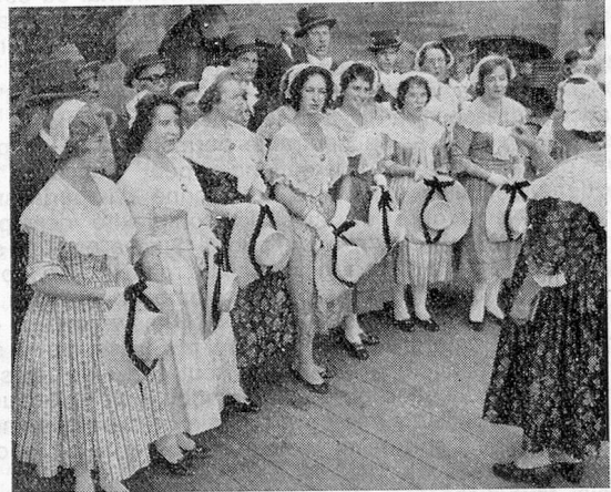
Un avant-goût de la Chanson Neuchâteloise qui animera notre Fête Nationale le 27 Juillet à Bruxelles.