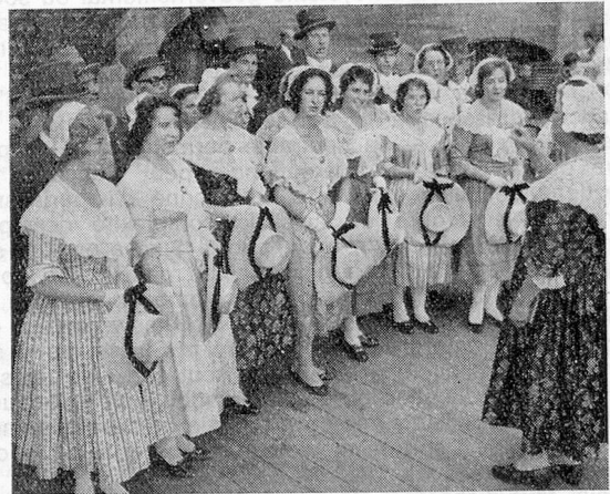
Un avant-goût de la Chanson Neuchâteloise qui animera notre Fête Nationale le 27 Juillet à Bruxelles.