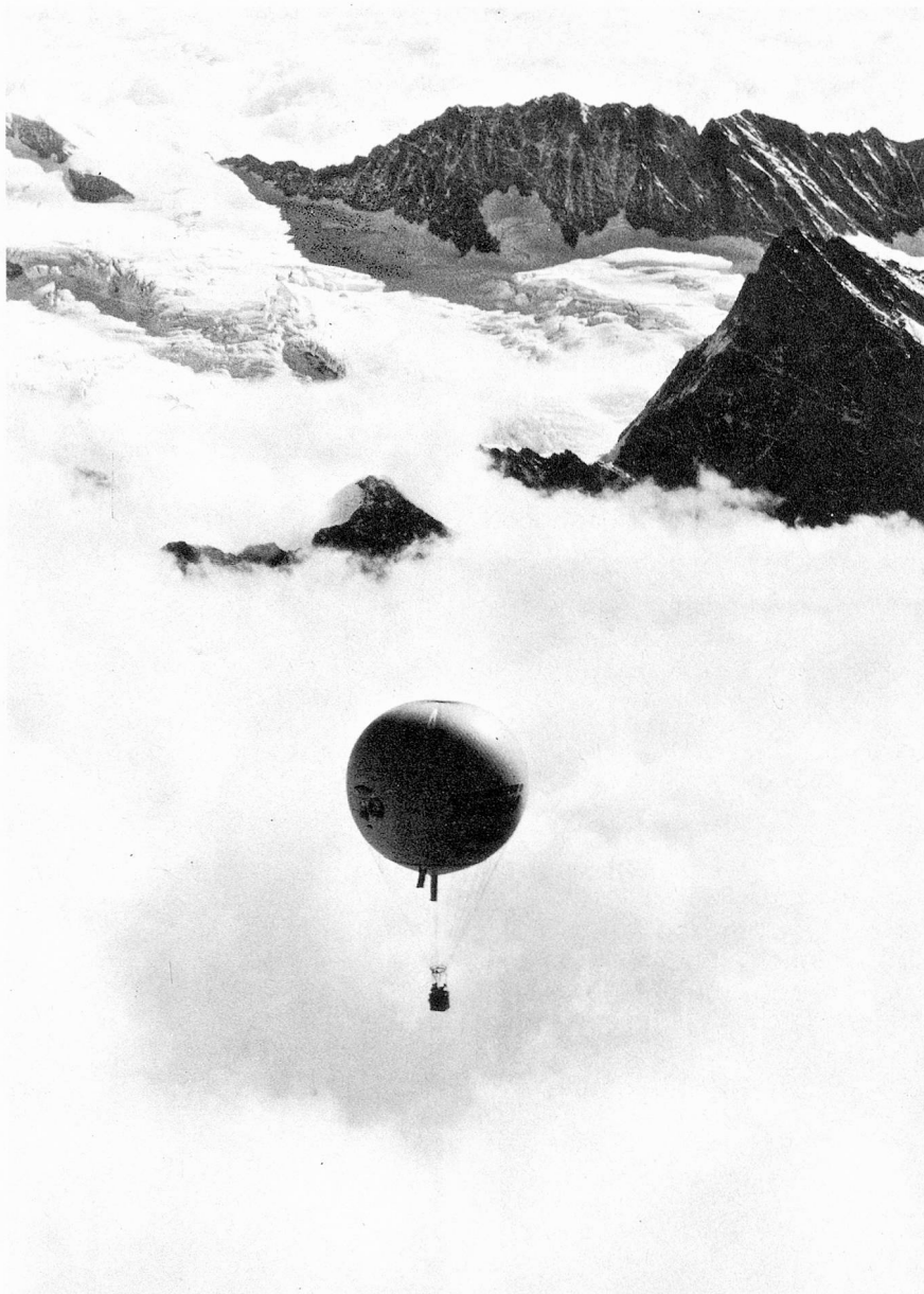
Ballon voguant au-dessus de la mer de brouillard