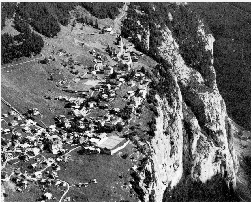
La station bernoise de Mürren (1639 m) et la vallée de Lauterbrunnen

Mürren présente de plus un intérêt tout particulier en raison de sa situation topographique: entourée et dominée par un cirque de très hautes montagnes, la station est abritée quelle que soit la force des