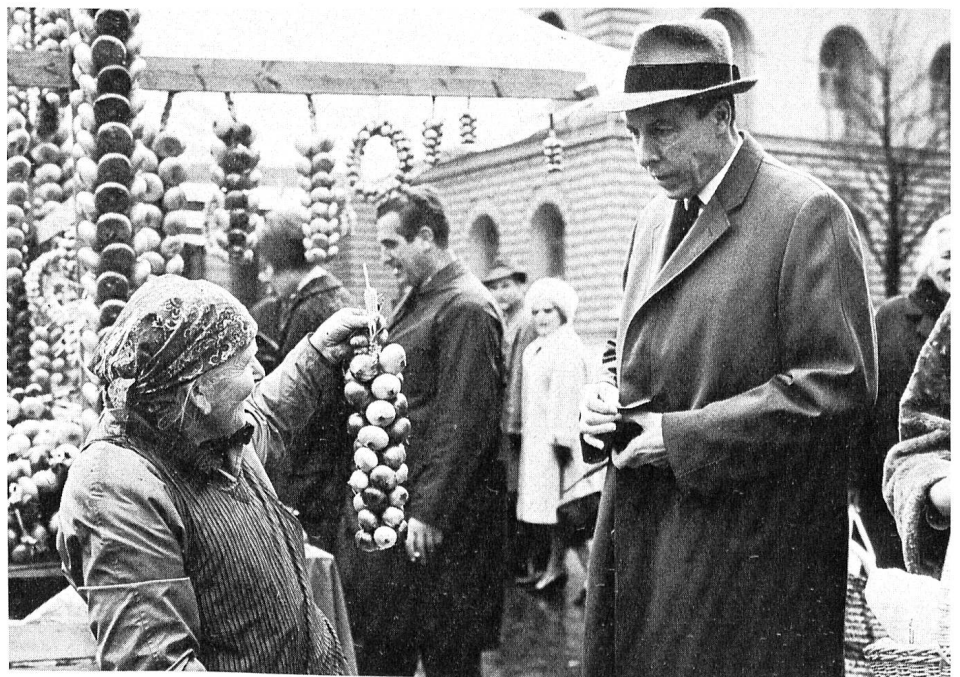
Herr Bundesrat Tschudi auf dem Markt

Bern ist eine leicht verträumte, mittelgrosse Stadt, deren Bevölkerung eher im Abnehmen begriffen ist und deren wenige grössere Fabriken eine nach der andern von den bedeutenden Industriebetrieben anderer Zentren des Landes übernommen werden. Es handelt sich wohl um die einzige europäische Hauptstadt – San Marino, Monaco und die «Kapitalen» anderer Zwergstaaten ausgenommen –, die über keinen eigenen internationalen Flughafen verfügt.