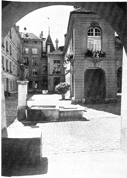
«Bern à la française»

Und doch, Bern ist eine Reise wert, und die Berner trauern – von einigen Geschäftsleuten abgesehen – in keiner Weise dem Fehlen internationalen Trubels nach, sondern erfreuen sich ihrer noch relativen Ruhe.