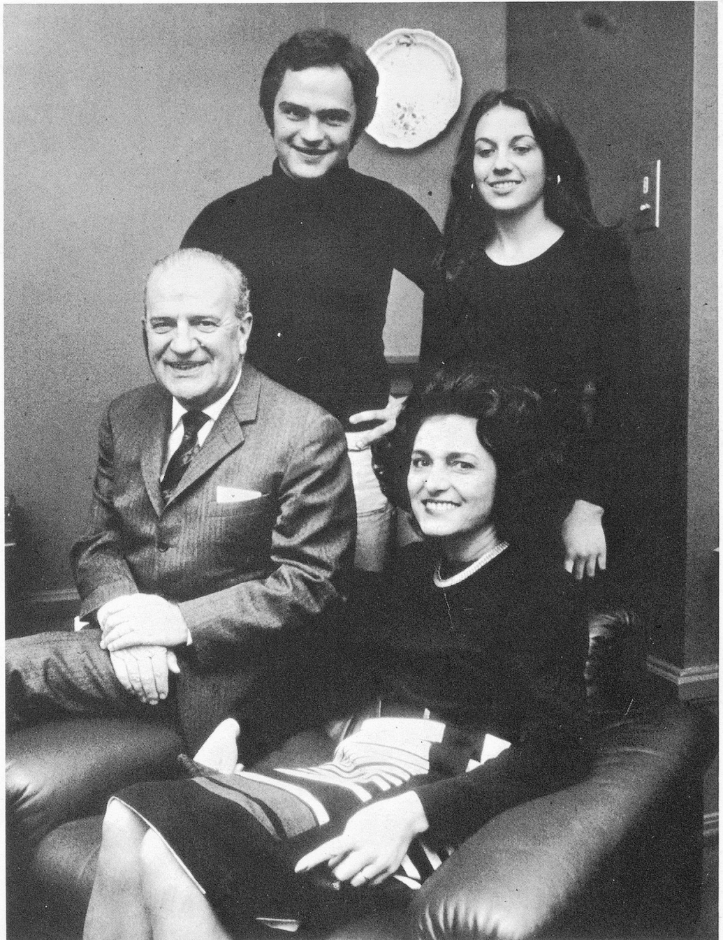
Le Président de la Confédération Helvétique M. Nello Celio, pour 1972, entouré de sa famille.