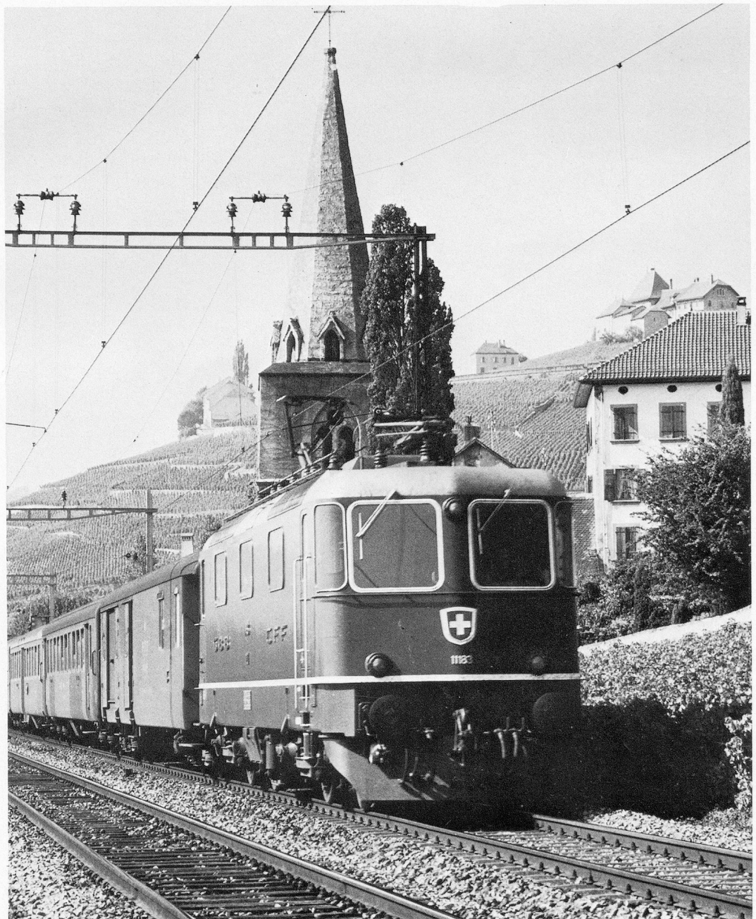
Le 125 e anniversaire de nos CFF

Nouvelles officielles: Révision de l'AVS/AI