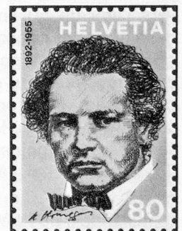
Arthur Honegger 1892-1955 Compositeur