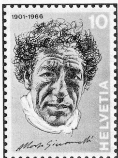
Alberto Giacometti 1901-1966 Peintre et sculpteur