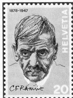
Charles Ferdinand Ramuz 1878-1947 Ecrivain