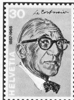
Le Corbusier Ch. Ed. Jeanneret 1887-1965 Architecte et peintre