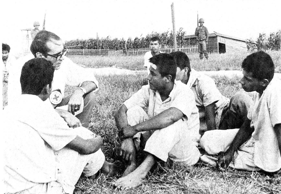
Besuch eines Lagers in Lateinamerika.

Durch dieses schreckliche Erlebnis von Dunant wurde die Idee des Roten Kreuzes geboren. Er improvisierte während einigen Tagen eine Hilfsaktion. Nach seiner Rückkehr nahm er sich vor, den Mitmenschen von diesem Ereignis zu erzählen und schrieb das Buch «Ein Andenken an Solferino», welches ganz Europa erschütterte. Durch diese Reportage schlägt Dunant eine Lösung vor: seine