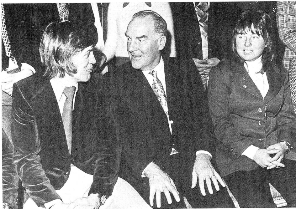
Bundesrat R. Gnägi hat anfangs Dezember unsere Sportkanonen empfangen. Wir erkennen ihn in Begleitung von M.-T. Nadig und B. Russi.