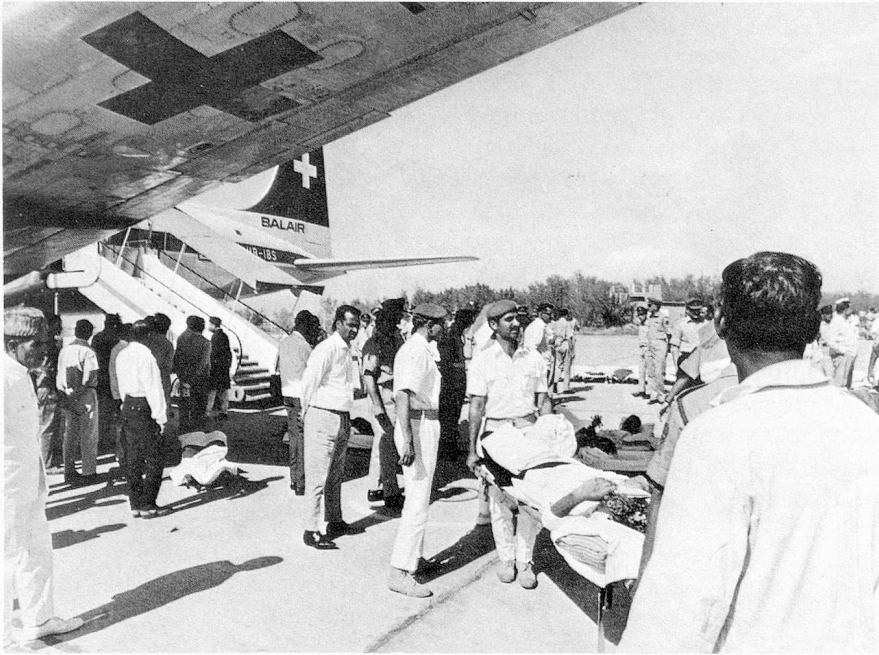
Rapatriment de prisonniers pakistanais depuis l'Inde.