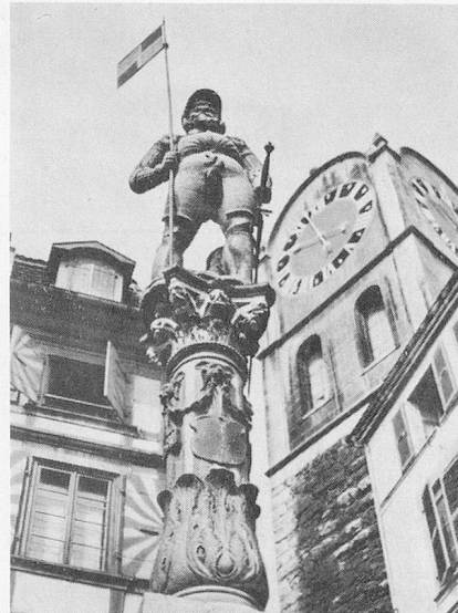
Le Banneret et la tour de Diesse