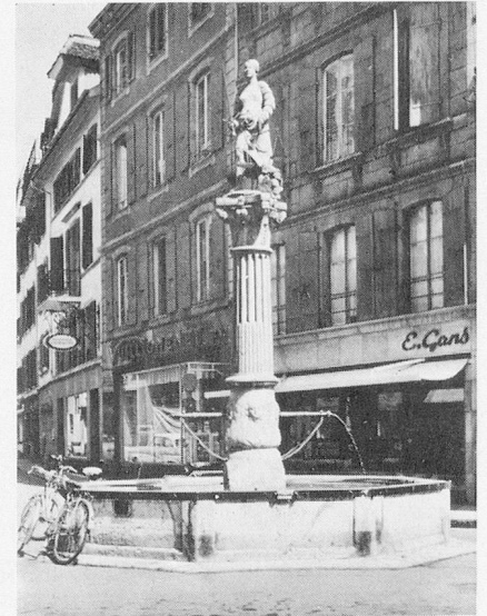
Fontaine de la justice