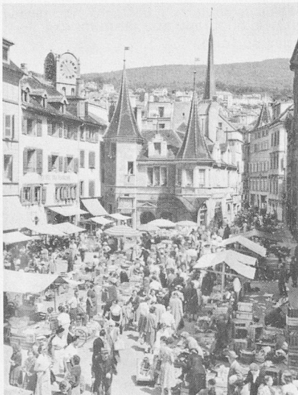
La place et la maison des Halles