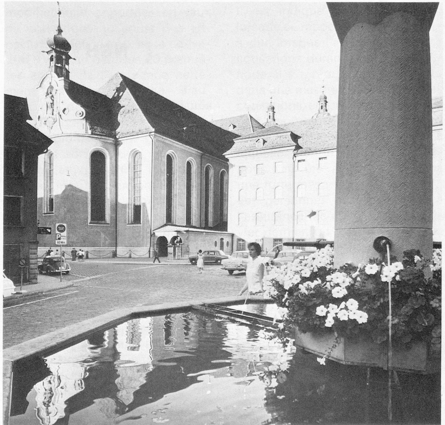
St-Gall, place Gallus

Le Secrétariat des Suisses de l'étranger, Alpenstrasse 26, CH-3006 Berne se tient à votre disposition pour tous les renseignements