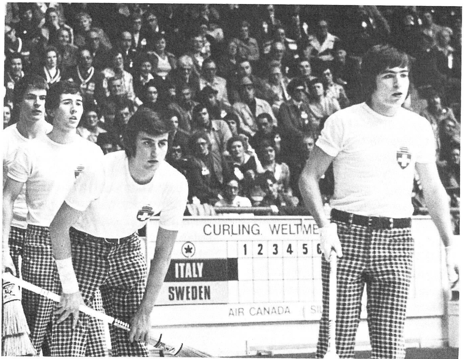
Die Mannschaft des Curling Club Dübendorf gewann die Bronzemedaille an den Curling-Weltmeisterschaften.

Die Schweiz erringt die Bronzemedaille an den Curling-Weltmeisterschaften, die in Bern durchgeführt worden sind.