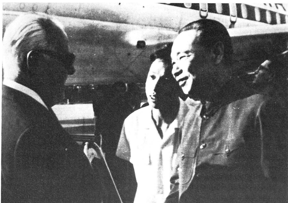
Bundesrat Pierre Graber wird in Peking von seinem chinesischen Amtskollegen Tschi Peng Fei empfangen.