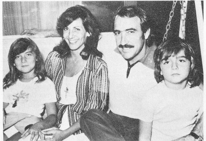
...en rueda familiar