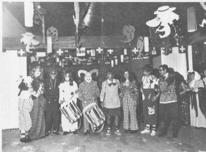
FIESTA DE CARNAVAL EN LA CASA SUIZA