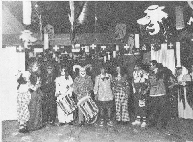
FIESTA DE CARNAVAL EN LA CASA SUIZA