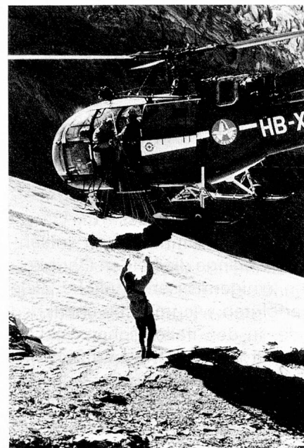
Rettung im Gebirge. An Stellen ohne Landemöglichkeit wird der Verletzte im Horizontalnetz geborgen.

rung gekennzeichnet. Das Städtchen breitet sich landwärts immer mehr um den Befestigungshügel aus. Innerhalb der alten Mauern aber kann sich noch heute kein Durchreisender dem historischen Erbe dieser Zähringergründung verschliessen. Pascal Ladner