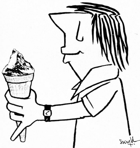
«Swiss ice cream»