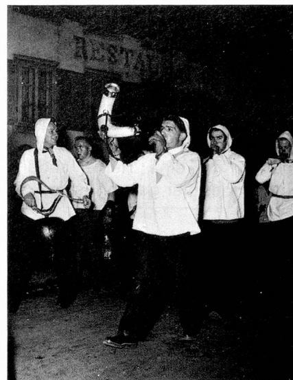
St. Niklausbrauch in Küsnacht am Rigi

Die lebhafteste, helle Einsiedler Mundart brachte einen ansprechenden Erzähler und bei aller Heiterkeit tiefgründigen Lyriker hervor: Meinrad Lienert (1865–1933). Im innern Land rang sich der Schwyzer Meinrad Inglin (1893–1971) in strenger Sprachzucht ein episches Werk ab, das