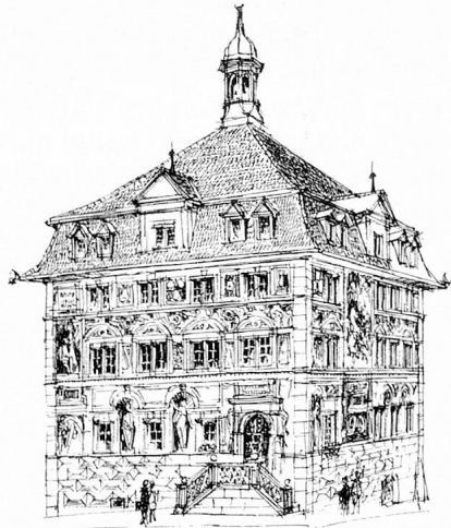
Das imposante Schwyzener Rathaus wurde von den Luzerner Steinmetzen Anton Ulrich und Melk Rufiner 1591–95 erbaut (GGKS)

Das Wort ist schon mehrmals gefallen. In andern Teilen der Schweiz hat es weniger Gewicht und bezeichnet Wahl- und Gerichtsgebiete. Im Land Schwyz bildet der Bezirk ein wesentliches Element der politischen Struktur. Die Bezirke sind geschichtlich um den Kern des Alten Landes (Bezirk Schwyz) gewachsen und zum Teil auch geographisch deutlich ablesbar. So war der Bezirk Gersau seit dem Mittelalter eine unabhängige, freie Republik und wurde erst Anfangs des 19. Jahrhunderts zum Kantonsgebiet geschlagen. Küssnacht, an der Westflanke der Rigi, ist wirtschaftlich gegen die Stadt Luzern ausgerichtet und träumte um 1830 – zusammen mit den äusseren Bezirken – von einer