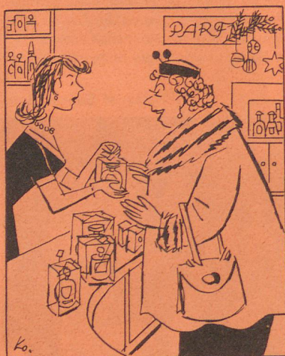
„Lassen Sie den Preis dran, Fräulein, es ist ein Geschenk.“