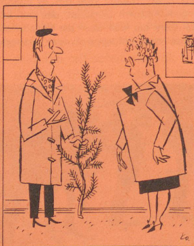
„Warte nur ab, bis ich ihn geschmückt habe.“