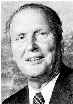
Willy Ritschard Vizepräsident Vorsteher des Eidgenössischen Verkehrs- und Energiewirtschaftsdepartementes