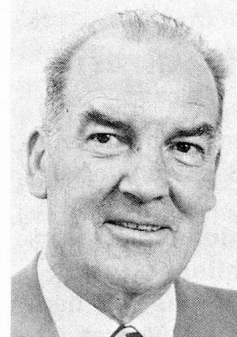
Rudolf Gnägi Vorsteher des Eidgenössischen Militärdepartementes

SCHWEIZERISCHE LANDESBIBLIOTHEK BIBLIOTHÈQUE NATIONALE SUISSE BIBLIOTECA NAZIONALE SVIZZERA