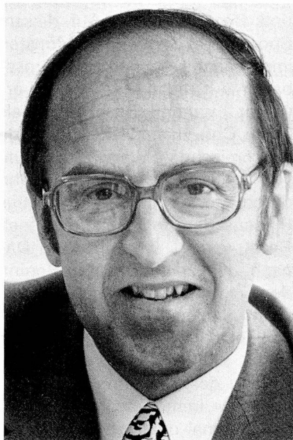
Kurt Furgler Bundespräsident Vorsteher des Eidgenössischen Justiz- und Polizeidepartementes