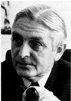
Ernst Brugger Vorsteher des Eidgenössischen Volkswirtschaftsdepartementes