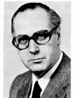
Hans Hürlimann Vorsteher des Eidgenössischen Departements des Innern