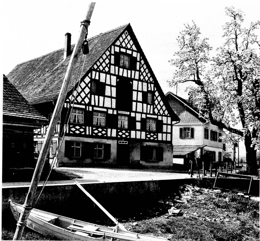
Riegelbau in Ermatingen