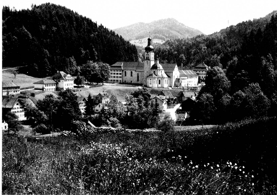
Die Benediktinerabtei in Fischingen

gel- und Schleifprodukte herstellt. Auch der Hinterthurgau im Süden ist heute stärker industrialisiert: grössere Betriebe der Textil-, der Möbel- und der Metallbranche (Sonnenstoren, Küchengeräten) sowie der chemischen Industrie arbeiten dort. Im ganzen eine bunte Palette!