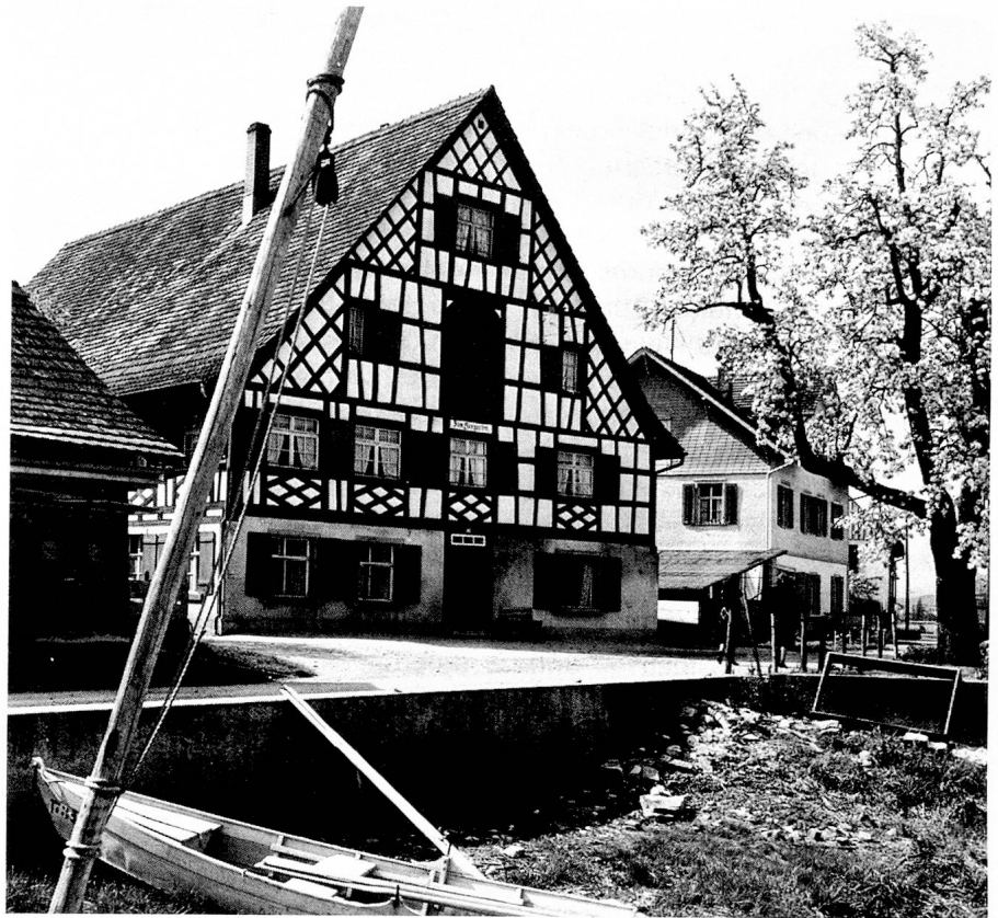
Riegelbau in Ermatingen