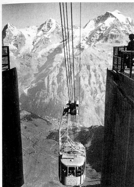
Blick vom Schilthorn auf Eiger, Mönch und Jungfrau

Von seinen Befugnissen massvoll Gebrauch machend, belies Bern dem Land Selbstverwaltung. Zu intensiverer Wirksamkeit verhalf dem Staat erst die Reformation (1528), die ihm in der Armenpflege, Schule und Sittenzucht neue Tätigkeitsfelder eröffnete und die in der bernischen reformierten Landeskirche erstmals eine sämtliche Staatsglieder gleichmässig umfassende Organisation schuf.