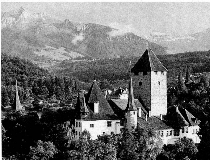
Schloss Spiez, von 1338 bis 1516 Sitz der Bubenberg-Dynastie