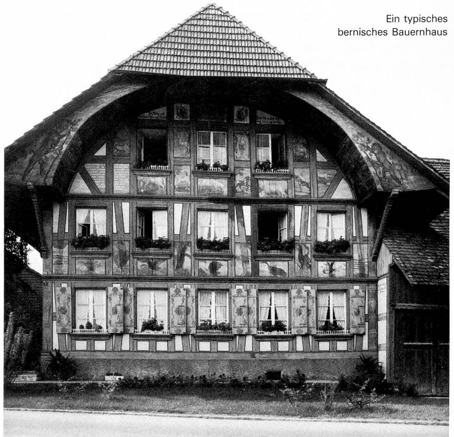
Ein typisches bernisches Bauernhaus

Mit seinen 410 Gemeinden, die in 27 Amtsbezirken zusammengefasst sind, ist der Kanton Bern tatsächlich so etwas wie eine Schweiz im Kleinen. Bern hat Anteil an den drei grossen schweizerischen Landschaftstypen: Jura, Mittelland und Alpen. Während im Berner Jura französisch gesprochen wird, und Biel in geradezu beispielhafter Weise als zweisprachig zu bezeichnen ist, herrscht im übrigen Kanton das «Bärndütsch» vor. Wer aber glaubt, «Bärndütsch» sei eine einheitliche Sprache, täuscht sich gewaltig. Es macht geradezu den Reiz der berndeutschen Sprache