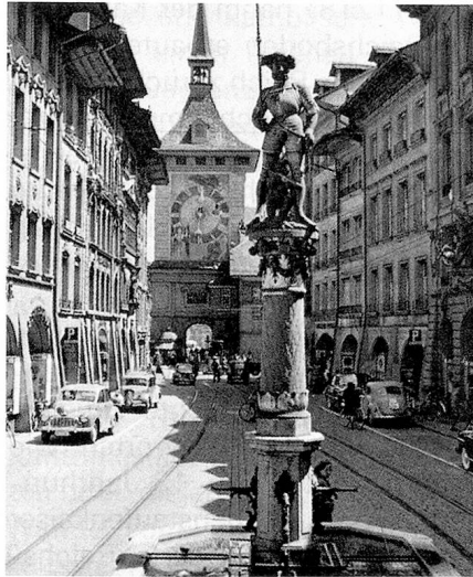
Bern: Marktgasse mit dem Schützenbrunnen und dem berühmten Zeitglockenturm

Als man 1953 die sechshundertjährige Zugehörigkeit Berns zur Eidgenossenschaft feierte, rief ein Gedenkspiel unter diesem Titel die an Höhen und Tiefen reiche Geschichte Berns in Erinnerung. In der Tat bildet die Verbindung Berns mit den Urkantonen Uri, Schwyz und Unterwalden nicht nur für die bernische Geschichte einen wichtigen Markstein, auch die Entwicklung der Urschweiz zu dem Staatsgebilde, das wir heute als Schweizerische Eidgenossenschaft bezeichnen, ist ohne das Hinzutreten und die Mitwirkung Berns nicht denkbar. Wenn heute ein unzufriedener Eidgenosse über «die von Bern» schimpft, dann meint er meistens die eidgenössischen Behörden mit ihrer Verwaltung, die in der Bundesstadt Bern konzentriert sind. Es gibt aber daneben noch das «andere Bern», den schweizerischen Gliedstaat Bern, von dem der St. Galler Carl Hilty, der als Staatsrechtslehrer an der Berner Universität wirkte, vor genau hundert Jahren schrieb: «Bern ist der einzige Kanton noch heute in der Eidgenossenschaft, der etwas wirklich ausgeprägt Staathaftes an sich trägt, der noch ein selbständiges Dasein zur Noth führen könnte und in dem grössere Staatsideen wirklich ausgeführt und auf ihren Gehalt geprüft werden können.»