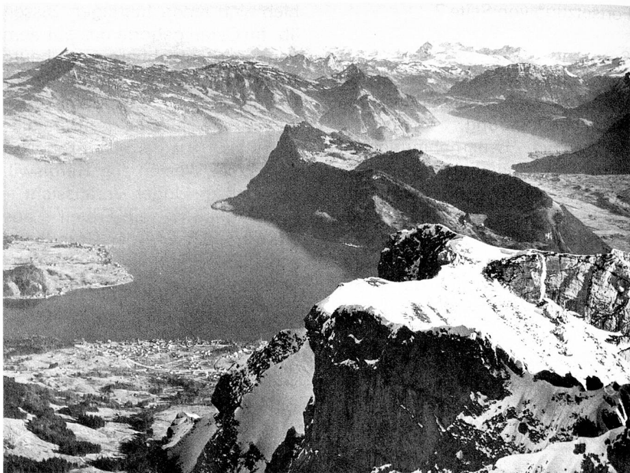
Aussicht auf den Bürgenstock und den Vierwaldstättersee

In der schweizerischen Politik jedoch hatte Nidwalden wenig Glück. Wiewohl es die Verbindungen zu den beiden andern Urständen geschaffen hatte, wurde es durch das volkreichere und bedächtiger Obwalden gar bald überflügelt. Im Rahmen der Tagsatzung galt fortan Nidwalden nur ein Drittel einer Standesstimme. Nur einmal im Ablauf von drei Jahren durfte es die Tagsatzung beschicken und die Landvögte in den gemeinen Vogteien stellen. Nidwalden hat sich gegen die Missachtung, dieses Zurückgebundenwerden stetsfort aufgelehnt, in Rat und Fehde, in der unglücklichen Franzosenzeit, hart