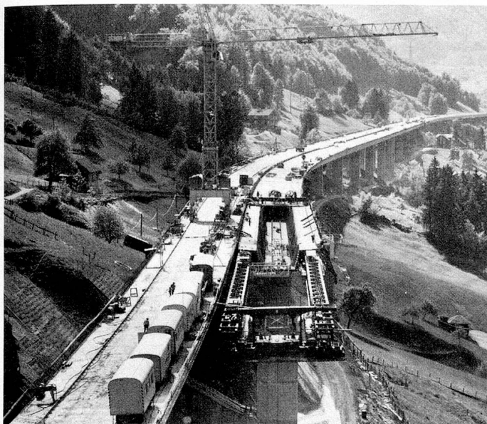
Bau eines Viaduktes zwischen Beckenried und Rüteneu