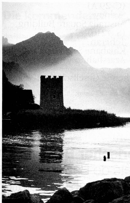
Der Schnitzerturm bei Stansstad am Vierwaldstättersee

Nur gerade der sonnige Sporn des Bürgenbergs, über dem See liegend und vor den Biswinden geschützt, wie auch die gegen Buochs und Beckenried schattenhalf abfallenden Hänge – auch sie durch Wildbäche zerrissen und zerschunden – gewähren ein eher friedliches Bild. Sonst aber strahlt die im Schatten nahestehender Berge gelegene Landschaft – Stans muss im Dezember und Januar die Sonne fast ganz vermissen – wenig Heiterkeit aus, ist eher düster, wie die dunklen Wälder, die sie umgeben, streng, verschlossen und allzeit gefährlich. Wer sich ihr anvertraut, muss wach sein, schnell von Entschluss,