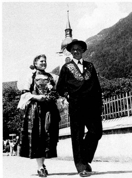
Ein Paar in traditioneller Nidwaldner Tracht