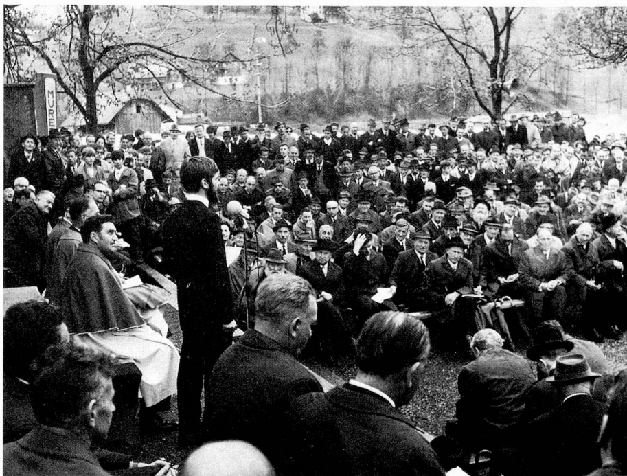
Landsgemeinde in Stans