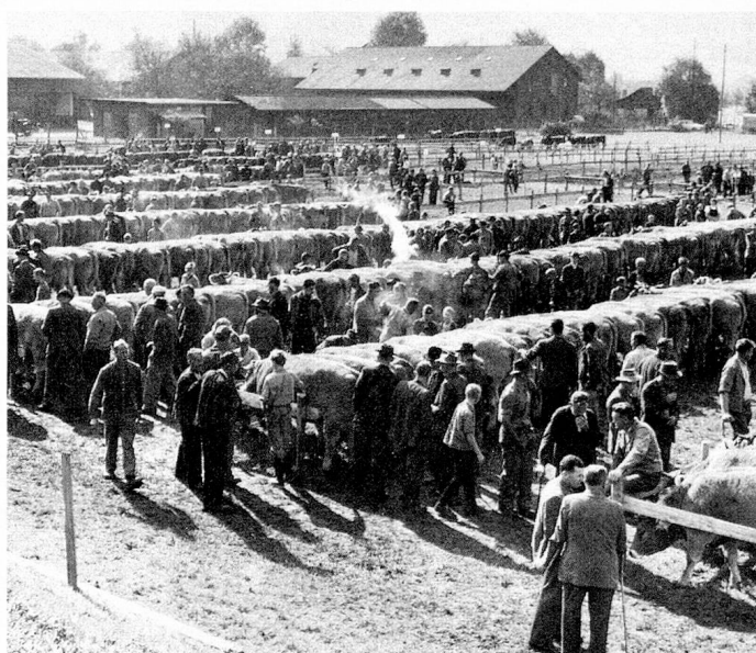
Rindermarkt in Wil

in seiner Ablehnung des anschlusswilligen Engelberg, wie auch zur Sonderbundszeit. Wenn heute seine Regierung billiger Abwägung gemeineidgenössischer Interessen zum Trotz auf einer vollen Standesstimme beharrt, so hat diese Haltung in der Geschichte ihren erklärbaren Grund.