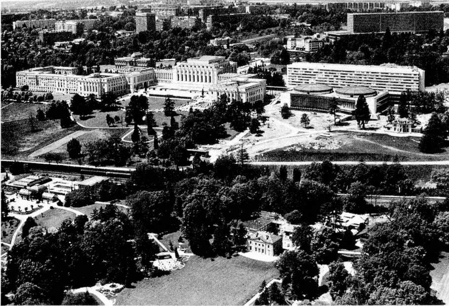
Sitz der UNO in Genf

getreten und arbeitet in verschiedenen von der UNO geschaffenen Nebenorganen mit, die sich hauptsächlich mit wirtschaftlichen und humanitären Fragen sowie mit multilateraler technischer Zusammenarbeit befassen. Sie nimmt an Weltkonferenzen der Vereinten Nationen teil, sofern sie auch Nichtmitgliedern der UNO offenstehen. Die friedenserhaltenden Aktionen unterstützt sie zurzeit durch einen finanziellen Beitrag an die Blauhelmtuppen in Zypern und indem sie den UNO-Beobachtern im Mittleren Osten ein Flugzeug zur Verfügung stellt. In New York und Genf unterhält die Schweiz je eine ständige Beobachtermission bei der UNO.