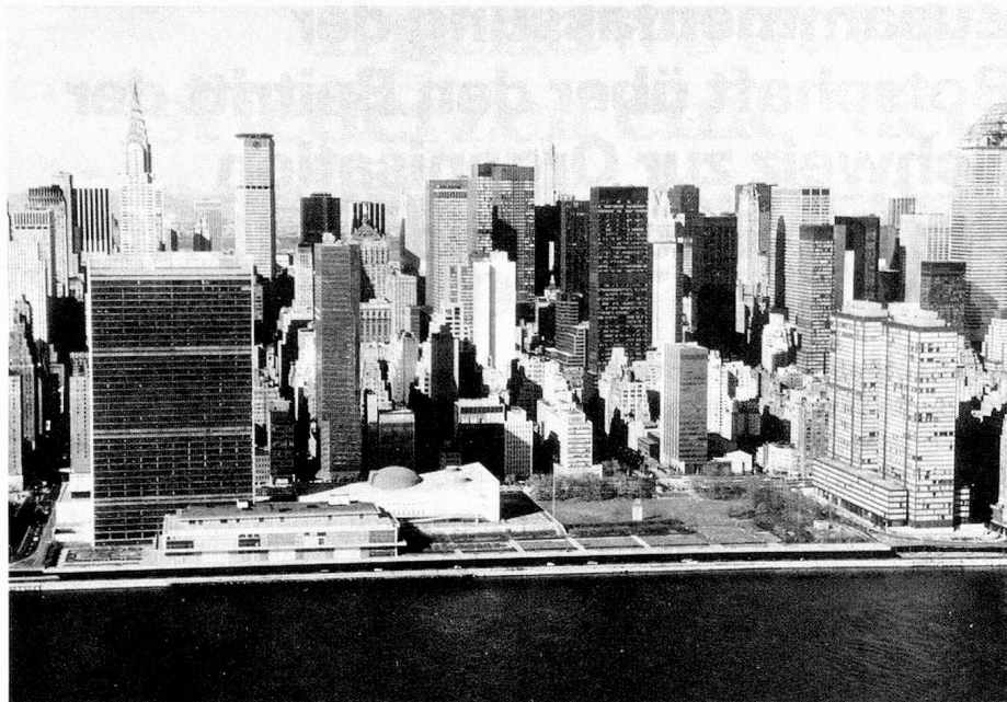
UNO-Hauptgebäude in New York

Verlauf des Kalten Krieges zeigte es sich, dass das in der Charta verankerte, von der Übereinstimmung der Grossmächte abhängige Sanktionensystem weitgehend unwirksam blieb; militärische Zwangsmassnahmen sind nie angewandt worden. Die Existenz der Nuklearwaffen hat zudem zu einer Veränderung der Konflikte geführt, welche die Entwicklung neuer Methoden der Friedenssicherung erforderte. Mit dem Einsatz von Beobachtern, Vermittlern und Blauhelmtrouppen schuf die UNO ein auf Freiwilligkeit beruhendes Instrument, mit dem sie die Vorbedingungen für eine friedliche Konfliktlösung schafft und allenfalls an dieser Lösung mitwirkt.