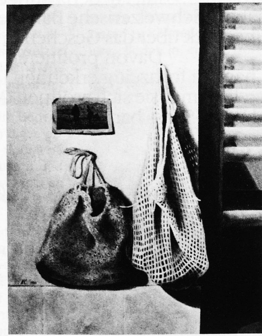
Norbert Clément «Abendgeläut» (Peru)