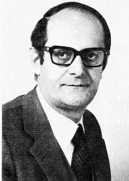
Botschafter C. Sommaruga

für allgemeine Büroarbeiten und Bedienung der Telefonzentrale (eventuell halbtags). Eintritt Mitte 1984. Büroerfahrung und Maschinenschreiben erforderlich. Bewerbungen mit den üblichen Unterlagen bitte an das Schweizerische Generalkonsulat, Cecilienallee 17, 4000 Düsseldorf 30.