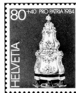
80 + 40 c. Museum Ariana, Genf Musée Ariana, Genève Museo Ariana, Ginevra