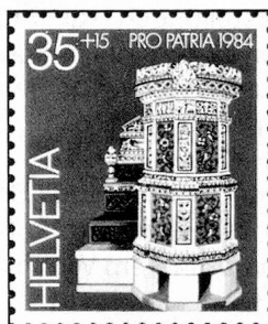
35 + 15 c. Landesmuseum, Zürich Musée nationale suisse, Zurich Museo nazionale svizzero, Zurigo

In diesem Jahr ist das Erträgnis der Bundesfeierspende für das Auslandschweizerwerk bestimmt, welches solche Zuwendungen seit 1924 alle 6 oder 7 Jahre erhalten hat. Empfänger sind insbesondere die Auslandschweizerorganisation und des-