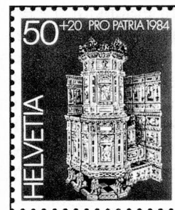
50 + 20 c. Freulerpalast, Näfels Palais Freuler, Nâfels Palazzo (Freuler), Nâfels