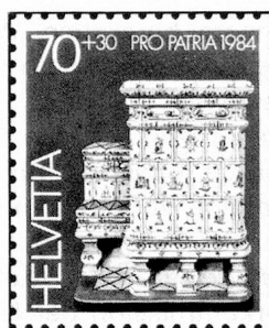
70 + 30 c. Musée gruérien, Bulle