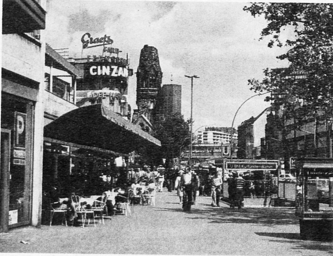
Gedächtniskirche und Kurfürstendamm

Allsich die Verhältnisse nach 1945 wieder etwas konsolidiert hatten, konnten wir bis zu 500 Mitglieder in unsere Kartei führen.