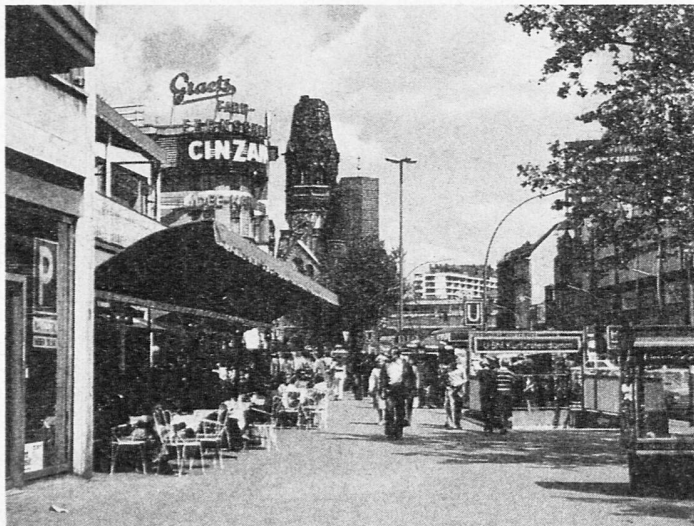
Gedächtniskirche und Kurfürstendamm

Als sich die Verhältnisse nach 1945 wieder etwas konsolidiert hatten, konnten wir bis zu 500 Mitglieder in unsere Kartei führen.