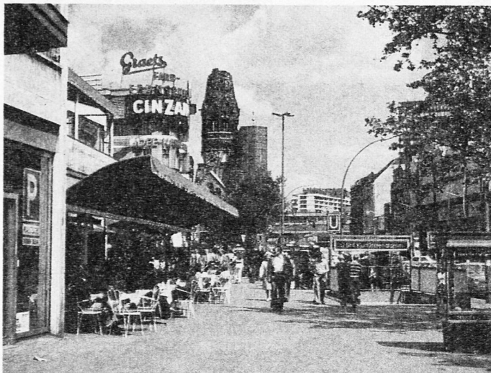
Gedächtniskirche und Kurfürstendamm

Im Juli 1861 wurde der Schweizer Verein Berlin gegründet. Er gehört damit zu den ältesten Auslandschweizer-Vereinen. Von den in Berlin bis 1945 noch registrierten Schweizer Clubs hat er als einziger die Tätigkeit wieder aufgenommen. Beim 75. Stiftungsfest 1936 zählte der Verein ca. 300 Mitglieder, bei ungefähr 3500 immatrikulierten Schweizern im damaligen Gross-Berlin.