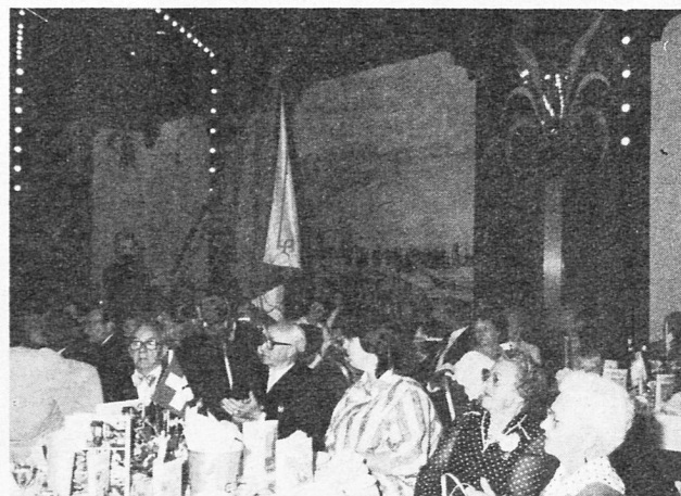
Hereintragen der alten Vereinsfahne in den Festsaal

Der älteste Schweizer Verein ist Anfang des 18. Jahrh. in London entstanden. Etwas später gründeten die Churer Konditoren in Venedig und Mailand weitere Vereine. Der Schweizer Verein Berlin, 1861 gegründet, erlebte glückliche und trübe Tage. Die Melker und Käser der Mark Brandenburg waren die ersten Mitglieder. Weitere Vereine gab es in Jena, Plauen, Chemnitz, Rostock, Königsberg und Danzig. 10 Jahre nach dem Verein wurde das Deutsche Reich gegründet. Die beiden Weltkriege brachten Zusammenbruch, doch auch