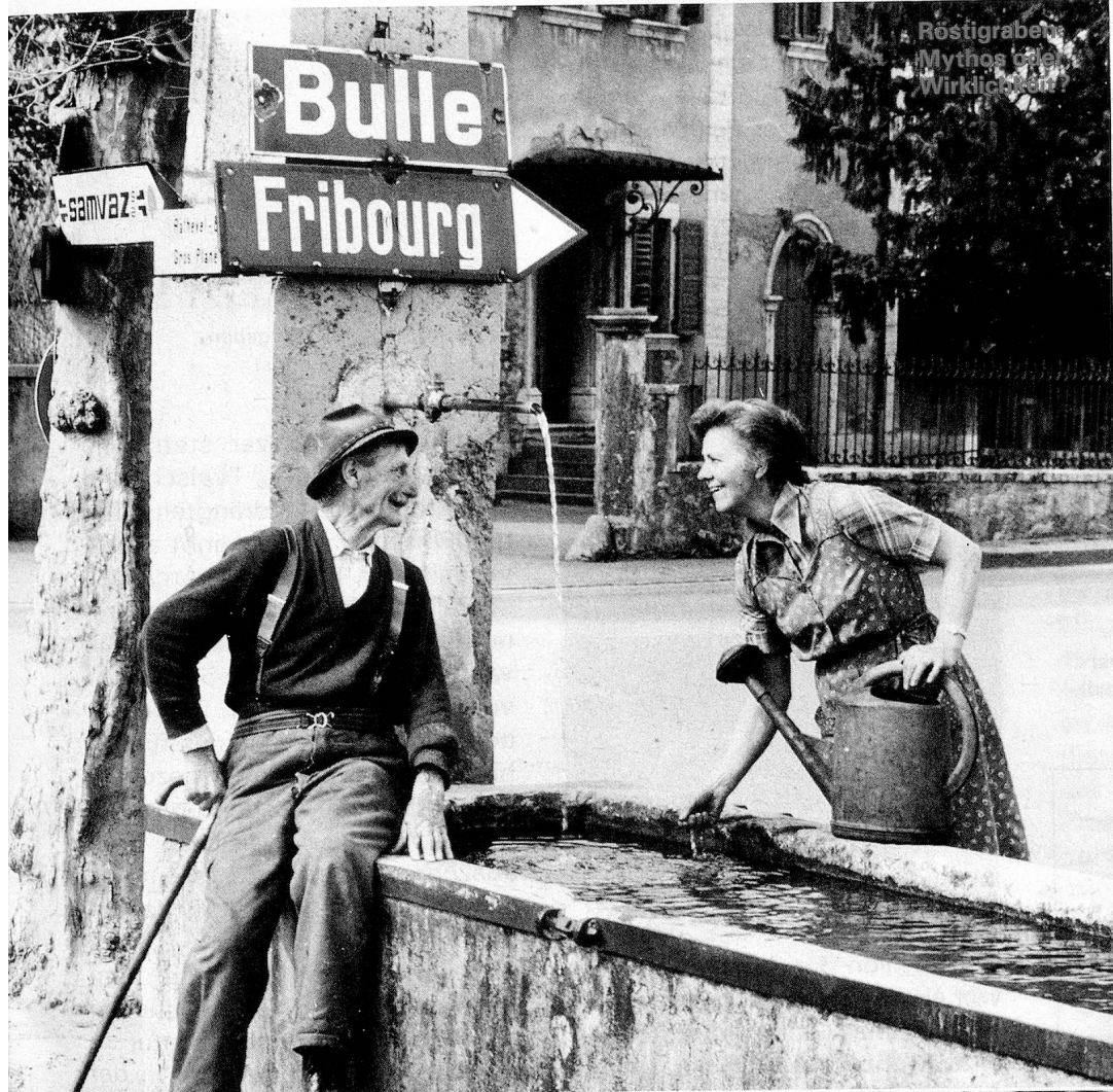
Röstigraben Mythos oder Wirklichkeit?