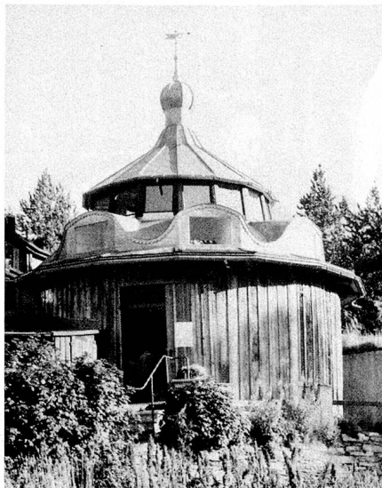
Das Atelier Segantini

Eines von Giovanni Segantinis wichtigsten Werken, das Triptychon «Werden – Sein – Vergehen» (Natura – Vita – Morte), erworben durch die Gottfried-Keller-Stiftung, Zürich, findet sich seit 1908 als Leihgabe im Segantini-Museum in St. Moritz. Dieses Triptychon war ein Auftrag an Segantini für die Weltausstellung 1900 in Paris. Mit einer «naturgetreuen alpinen Sinfonie» wollte man im Schweizer Pavillon in der Zeit des aufkommenden Alpentourismus für das Oberengadin werben. Das stolze Projekt scheiterte dann an der Finanzierung.