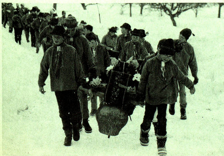
«Chalandamarz» – ein alter Brauch, mit dem die Engadiner Jugend alljährlich den Frühling einleitet.