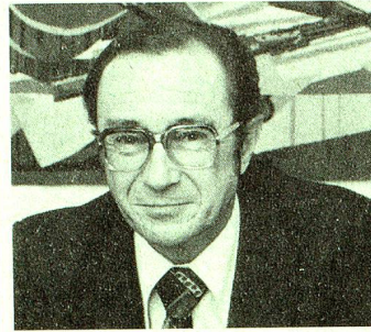
Bundespräsident: Pierre Aubert

Geboren am 3. März 1927 in La Chaux-de-Fonds. Bürger von Savagnier/NE. Verheiratet und Vater von zwei Kindern. Rechtsanwalt. Bundesrat seit 7. Dezember 1977.