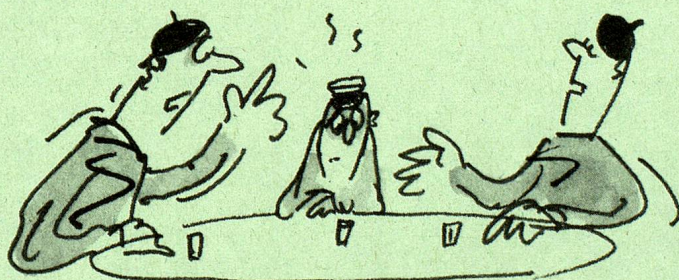
Angstbild: Sprachlich den Anschluss verpassen. Gute Vorbereitung erleichtert den Einstieg.

lassung meist eine Prüfung in der Unterrichtssprache ablegen. 3. Besitz eines Maturitätsausweises, der von der betreffenden Hochschule als genügend eingestuft wird bzw. Bestehen einer Aufnahmeprüfung. Die Zulassung zu höheren Semestern von Studenten mit einem begonnenen oder abge-