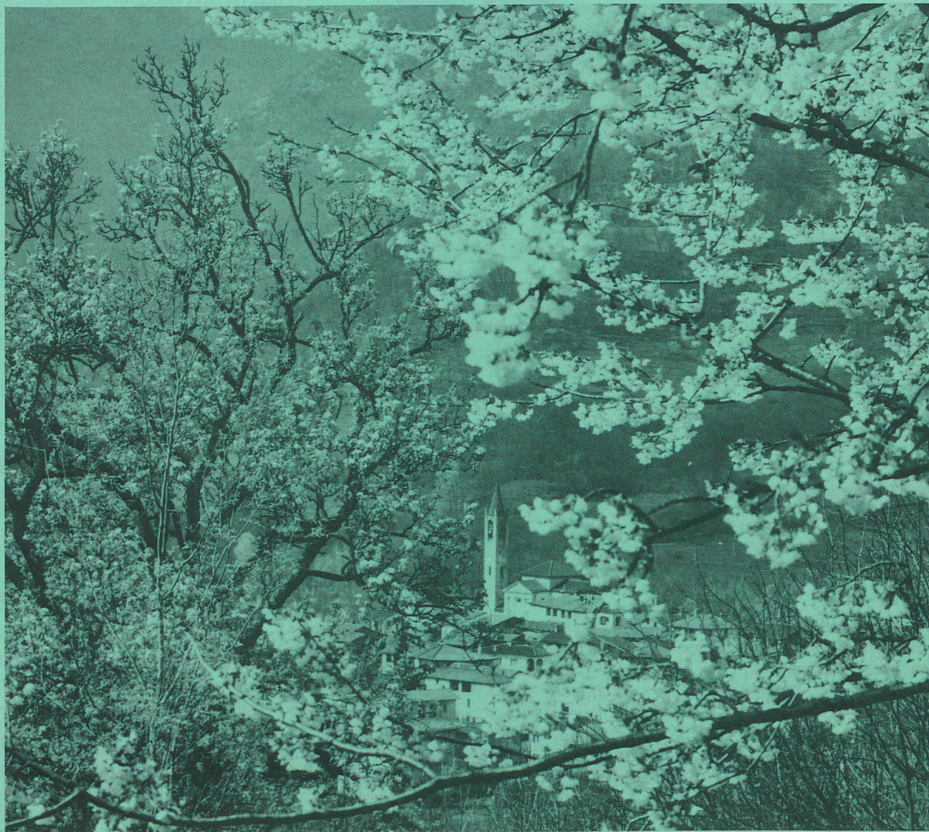
Frühling in Ponte Capriasca/Tessin.