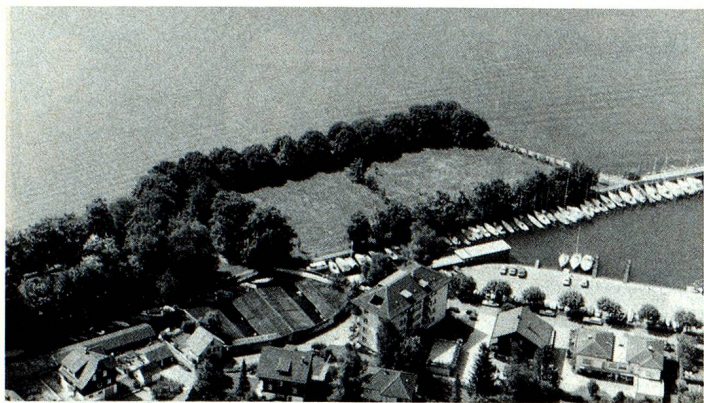
Platz der Auslandschweizer