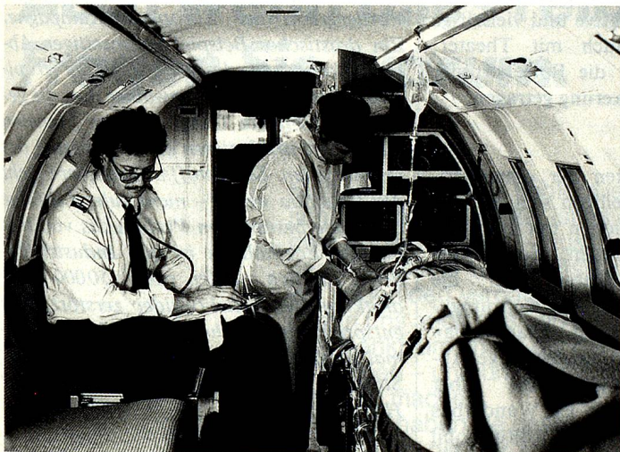
Die Rega-Ambulanzjets wurden im vergangenen Jahr zu 729 Einsätzen ins Ausland gerufen. Unser Bild zeigt die Innenansicht des im März 1988 in Dienst gestellten neuen Ambulanzflugzeugs vom Typ British Aerospace BAe 125-800B mit zwei Intensivplätzen und insgesamt 3 Liegeplätzen.

Die permanente Einsatzbereitschaft und die vollprofessionelle Organisation machen die Rega (Abkürzung für Rettungsflugwacht und Garde Aérienne) zu einer sehr effizienten Lebensretterin mit 24-Stunden-Betrieb während 365 Tagen im Jahr.