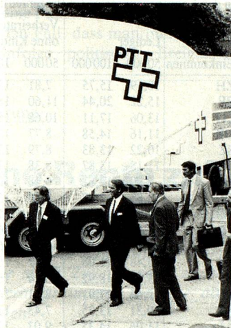
Das «Ohr» zur Welt: Bundesrat Ogi (Mitte) vor der transportablen Satelliten-Bodenstation in Näfels.

Minister Fetscherin, Chef des Auslandschweizerdienstes im EDA, beschäftigte sich zur Hauptsache mit den schon heute bestehenden Problemen, denen sich die Schweizer in EG-Ländern gegenübersehen und diagnostizierte eine fortschreitende «passive Diskriminierung»: Es muss nämlich angenommen werden, dass im allgemeinen die zunehmende Verbesserung der Lage der EG-Ausländer – ohne dass dieser Prozess bewusst gefördert würde – vermehrt zu einer subjektiven Verschlechterung der Stellung der Auslandschweizer führen