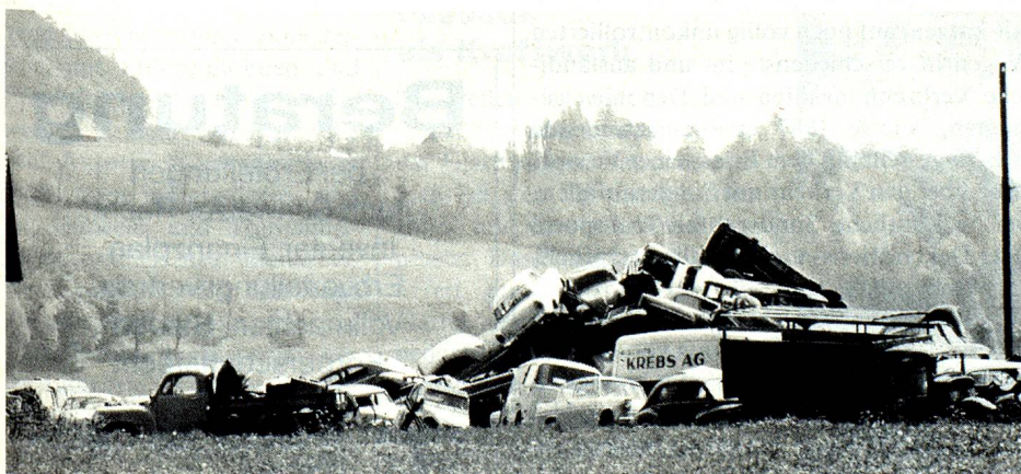
Aus den Augen, aus dem Sinn? Die Sanierung ungeeigneter Abfalldeponien dauert Jahre und verursacht enorme Kosten.

lawine volumenmässig einigermaßen zu bewältigen. In qualitativer Hinsicht wurde allerdings insbesondere die Tatsache, dass in der Schlacke, im Filterstaub und in der Abluft dieser Anlagen erhebliche Schadstoffe zurückbleiben, lange Zeit völlig verdrängt. Neben den KVA, in denen rund 80 Prozent der Siedlungsabfälle verbrannt werden, bestehen in der Schweiz nur vereinzelte Anlagen zur Verwertung bzw. zur Weiterbearbeitung spezieller Abfallstoffe. Zu nennen sind etwa Kompostieranlagen für die in einzelnen Regionen separat gesammelten Grünabfälle, die Anlagen der Industrie zum Altpapier-, Altglas- und Altmetall-Recycling, verschiedene Anlagen zur Abtrennung von Öl, Fett und Lösungsmitteln aus verschmutzten Abwässern sowie einzelne im Auf- und Ausbau begriffene Triage- und Vorbehandlungszentren für Sonderabfälle. Das letzte Glied der Kette bilden – neben den Transporteuren, die viele ungeliebte Stoffe ins Ausland verfrachten – die Deponien. In diesem Bereich wurden auf der Basis des Gewässerschutzgesetzes von 1971 und der darauf abgestützten Deponiericht-